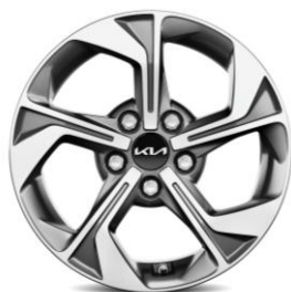
16-calowe felgi aluminiowe, wersja M