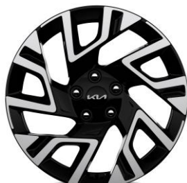
18-calowe felgi aluminiowe, wersja M (opcja), L, Tribute, Business Line