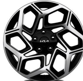
18-calowe felgi aluminiowe, wersja GT-Line