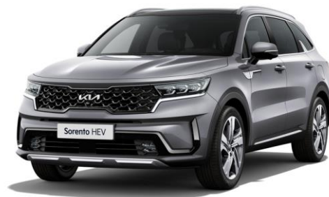
Steel Gray (KLG)