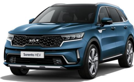
Mineral Blue (M4B)