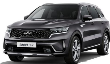
Platinum Graphite (ABT)